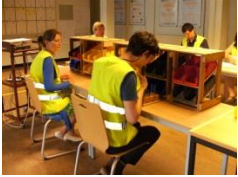
Lean Manufacturing Integrator